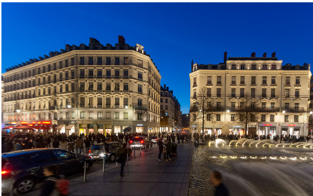
La rue de la République et sa fontaine sont équipées avec des projecteurs à LED de haute puissance.

Contracting Authority: City of Lyon Lighting designer: Atelier Roland Jéol Installer: Bouygues E&S - TPR